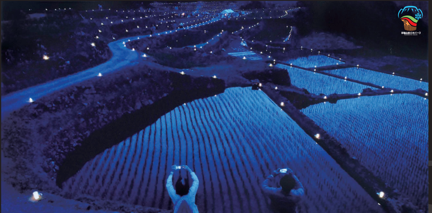
第2回 最優秀作品「幻想の石垣田」