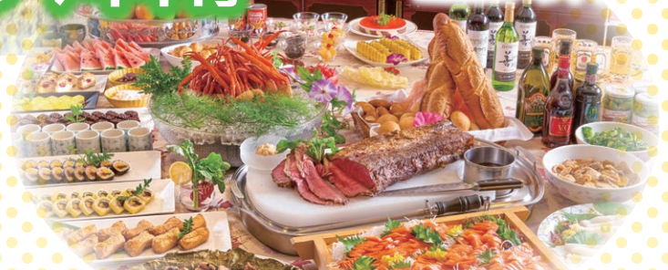
※基本の夕食は、和洋中バイキングをご用意しております。 ローストビーフ、スワイガ二食べ放題、甘玉ビ刺身は毎日提供。(和食会席への変更も承ります。)