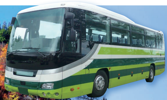
※ご利用人数によって、バスの型、色、種類が変わる場合がございます。

四季の魅力あふれる高原リゾート ニュー・グリーンピア津南で楽しむ 自然、体験、遊び、温泉、旬の味覚。 直行バスならではの お手軽で快適な旅を 思う存分ご満喫ください。