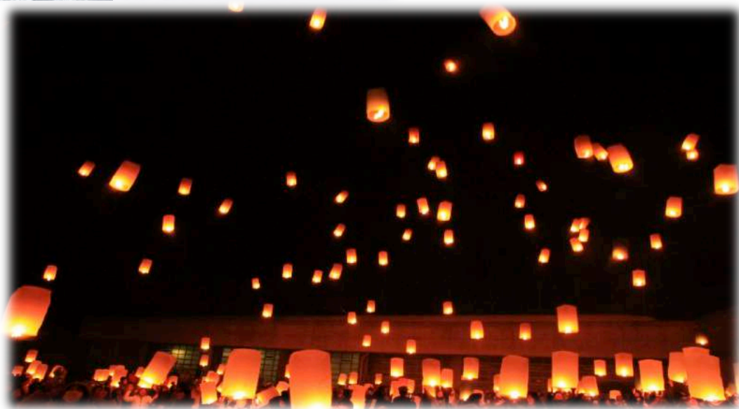
スカイランタン の宿